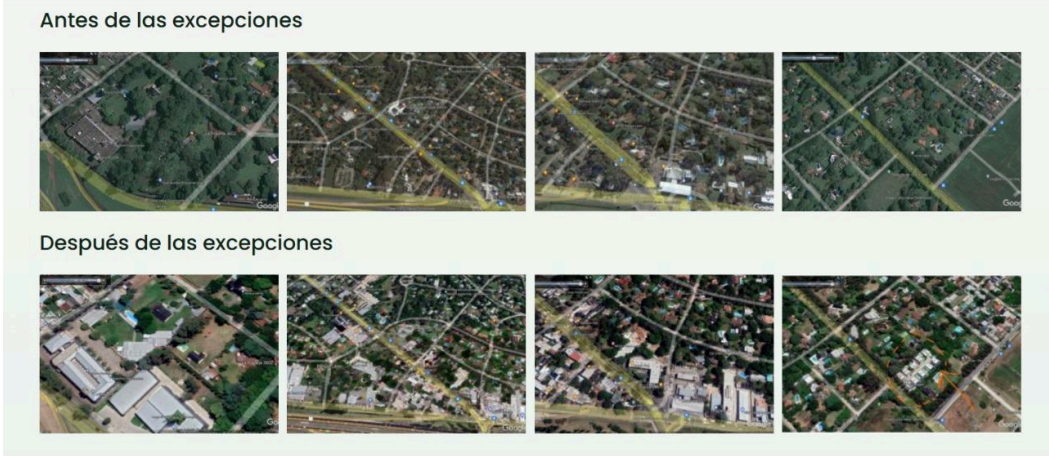
Imágen 3: visión satelital de Parque Leloir antes y después de las excepciones a la construcción. Se pueden observar los cambios en la masa arbórea y las edificaciones.