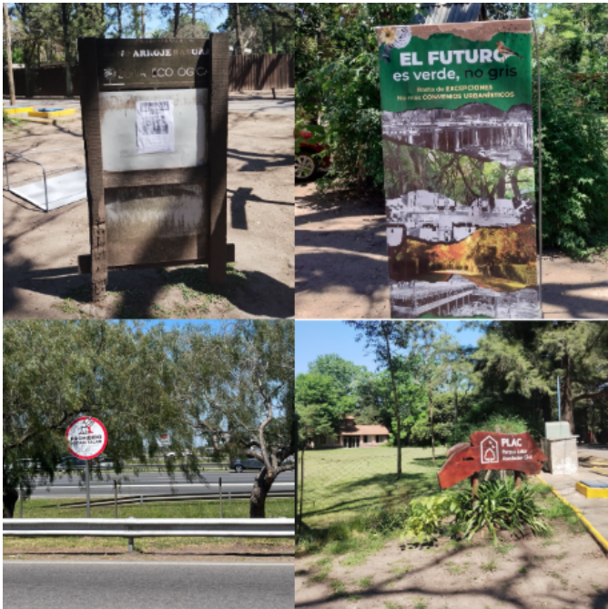
Figura 1: fotografías tomadas el día de la visita a PLAC (19/10/24). Carteles dentro del predio.