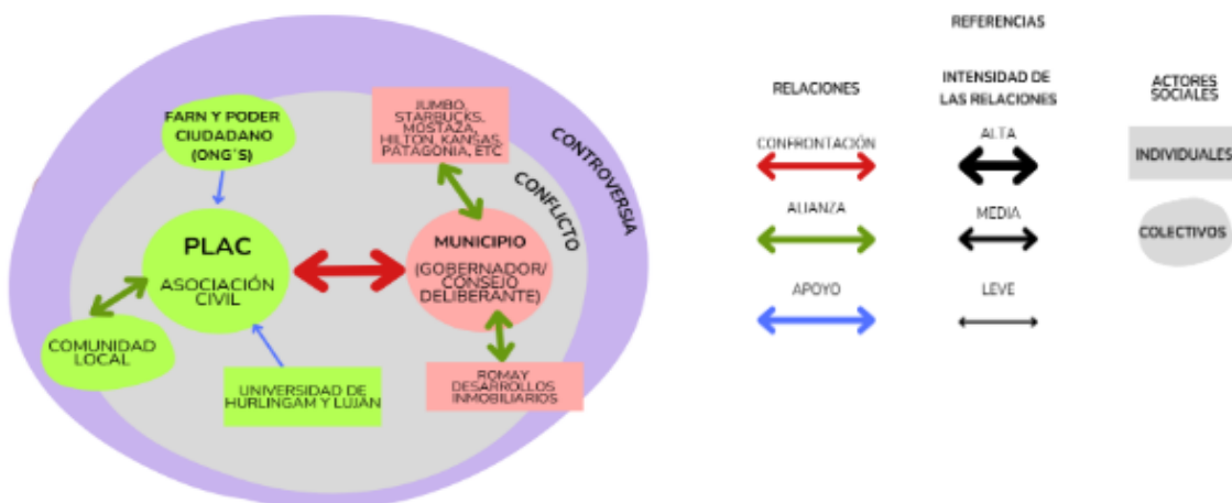
Imagen 1: Mapa de actores involucrados en el conflicto con sus respectivas referencias.

Sin embargo, la municipalidad tampoco actúa sola en el conflicto, sino que tiene un vínculo estrecho con desarrolladores privados, quienes muchas veces buscan en la municipalidad la posibilidad de generar cambios en las normativas urbanísticas para llevar a cabo distintos proyectos, ya que, esta tiene la capacidad de modificar las normativas de uso del suelo y de aprobar excepciones a la ley de protección ambiental, lo que facilita el avance de proyectos inmobiliarios que impliquen la tala de árboles o la destrucción de espacios verdes (Musse, V., 2017). Un claro ejemplo de estas alianzas es aquella existente entre la municipalidad y Romay desarrollos inmobiliarios, encargados del Proyecto "Thays Parque Leloir" que junto con empresas privadas como Jumbo, Hilton, Kansas, Mostaza, Patagonia, Starbucks, entre otras, desean desarrollar sus actividades económicas y establecerse en el lugar (Murgieo, L. y Nosedá, A., 2018).