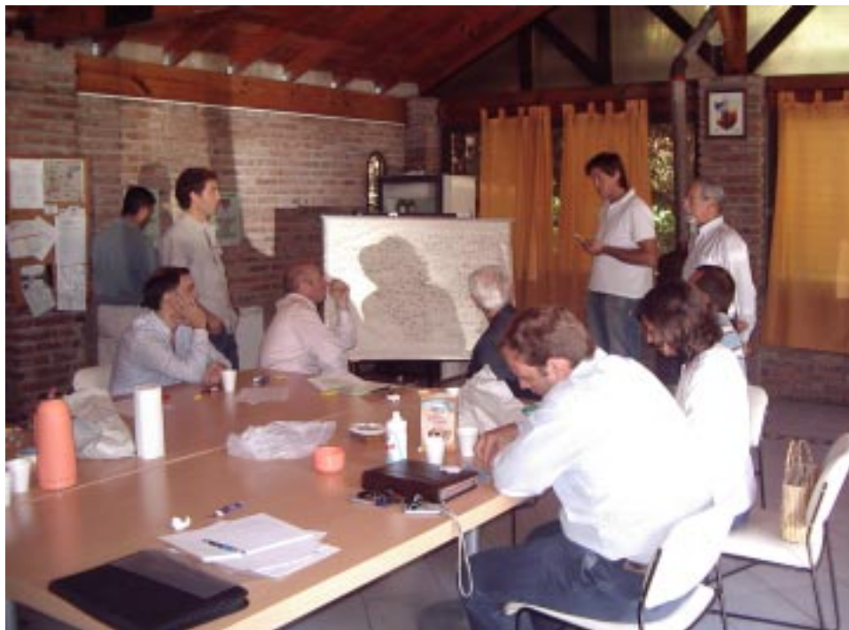
Mañanas de trabajo con los representantes de las inmobiliarias en nuestra Sede

Esperamos como es costumbre, la ayuda de los vecinos en el cuidado de la obra que tanto nos costó, y es nuestro deseo poder informar sobre la finalización de la misma en nuestra próxima edición.