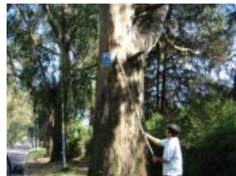
Parque Leloir Asociación civil

Polución Visual: Nuestro parque se ve agredido por este mal de la vía pública.