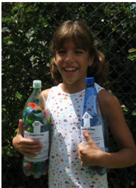
Seamos solidarios y Colaboremos

Queremos invitarlos a participar con nosotros en esta campaña.